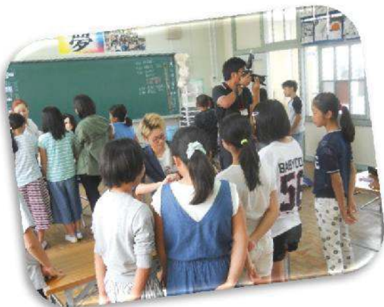
ウィッグに触ってみて